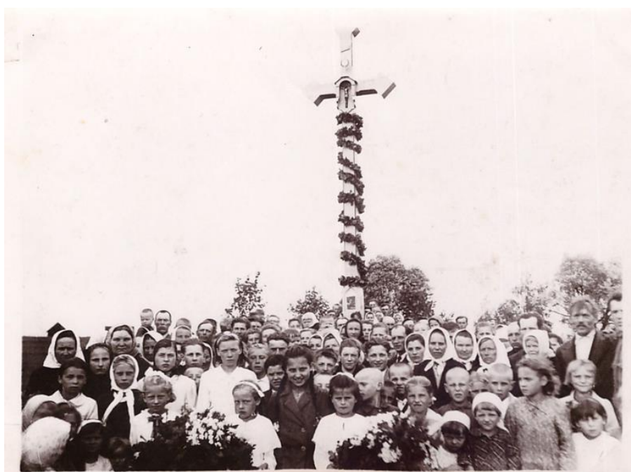
Kryžiaus šventinimo dalyviai. 1943 m.