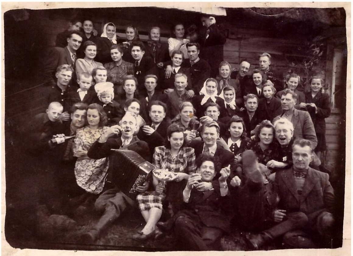
Sedeikiečiai švenčia pakermošę. Apie 1959 m.