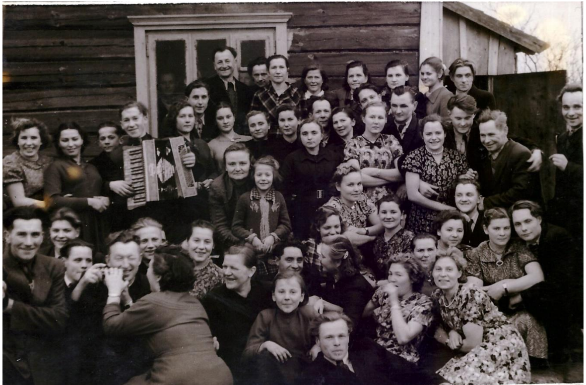
Taip sedeikiečiai ir svečiai linksmiasi 1953 m.