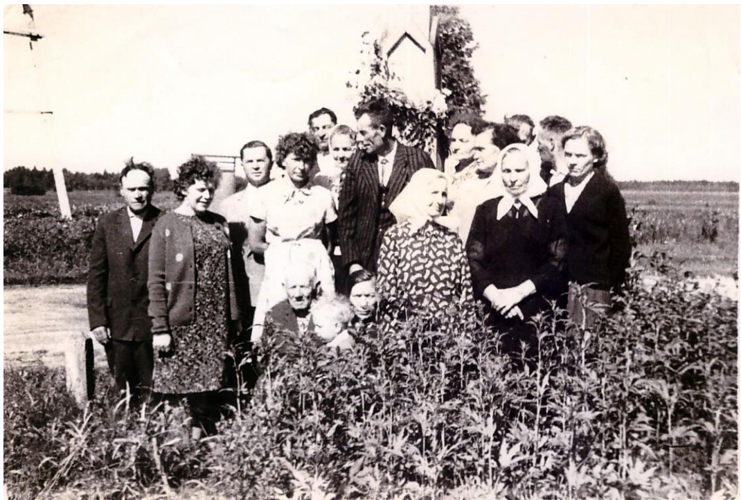
Sedeikiečiai prie kryžiaus apie 1965 m