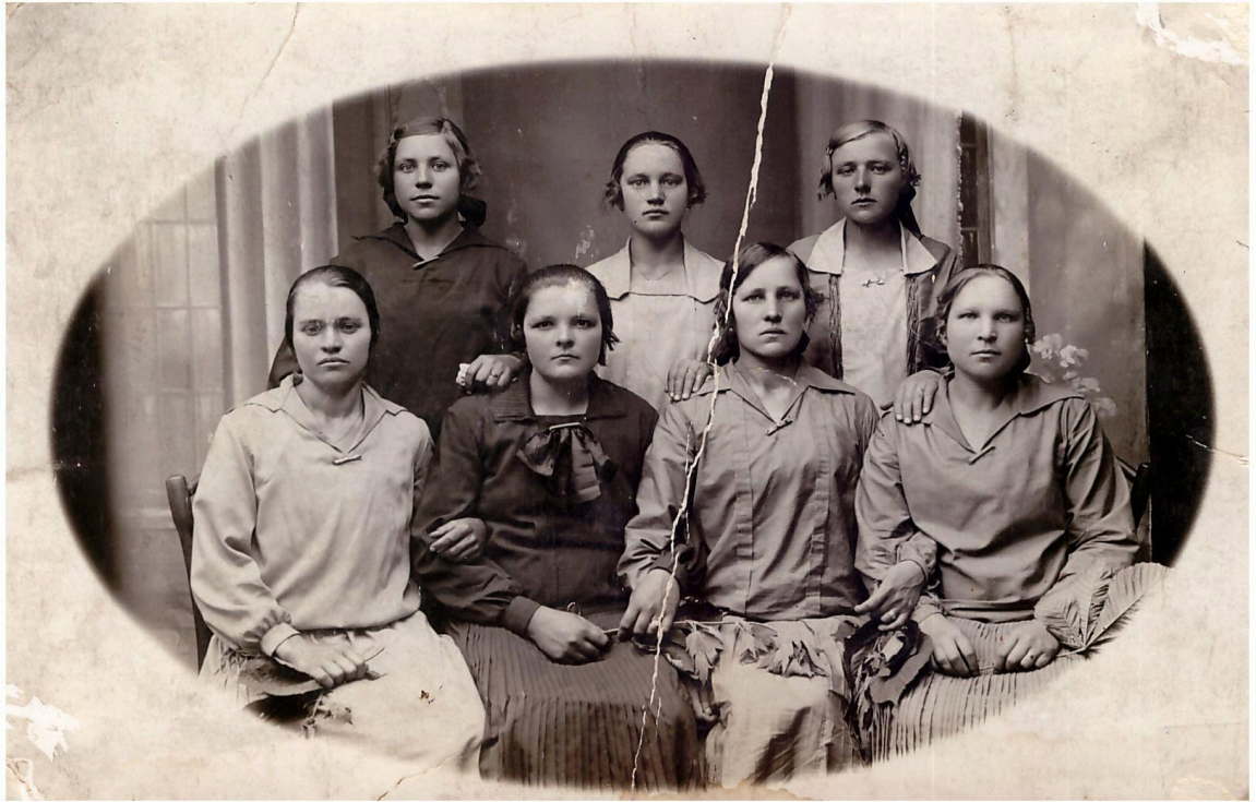
Sedeikietės apie 1923–1925 m.