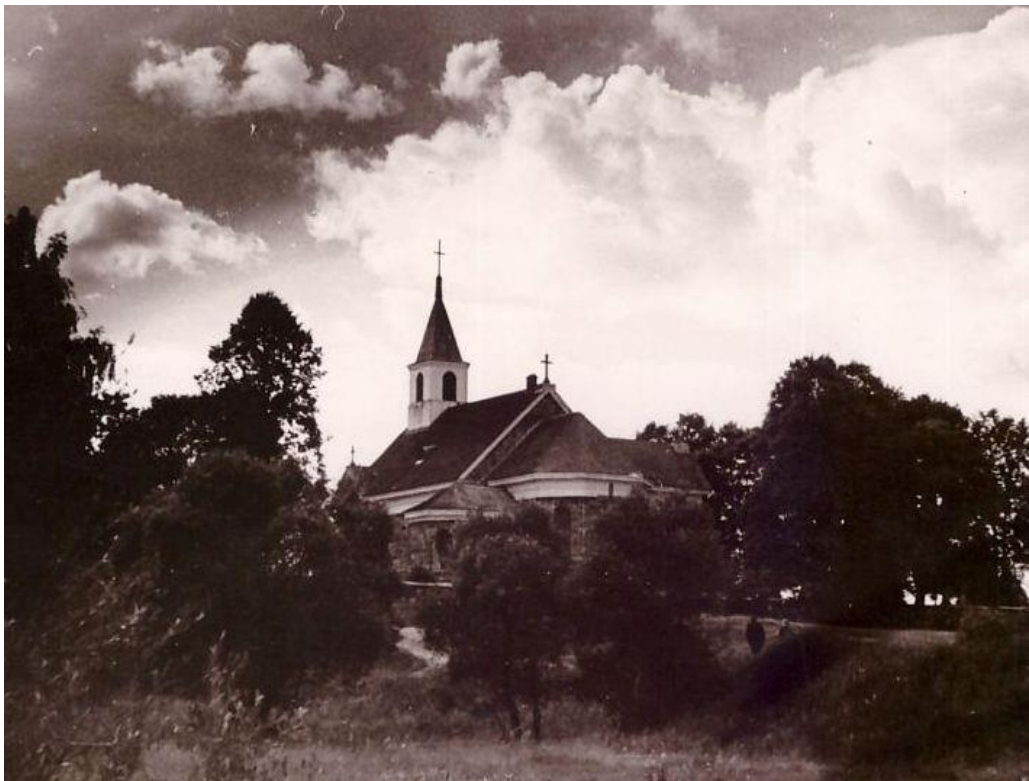
Andrioniškio Šv. apaštalų Petro ir Povilo bažnyčia.

Sedeikių kaimas priklauso Andrioniškio parapijai.