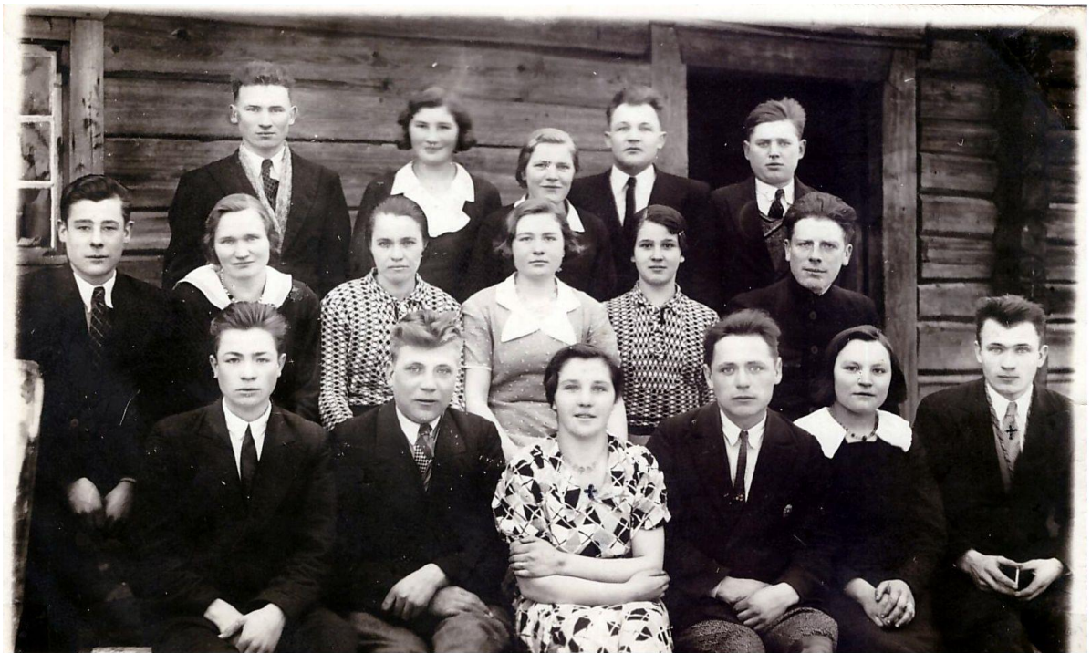
Sedeikių kaimo jaunimas 1936 m.