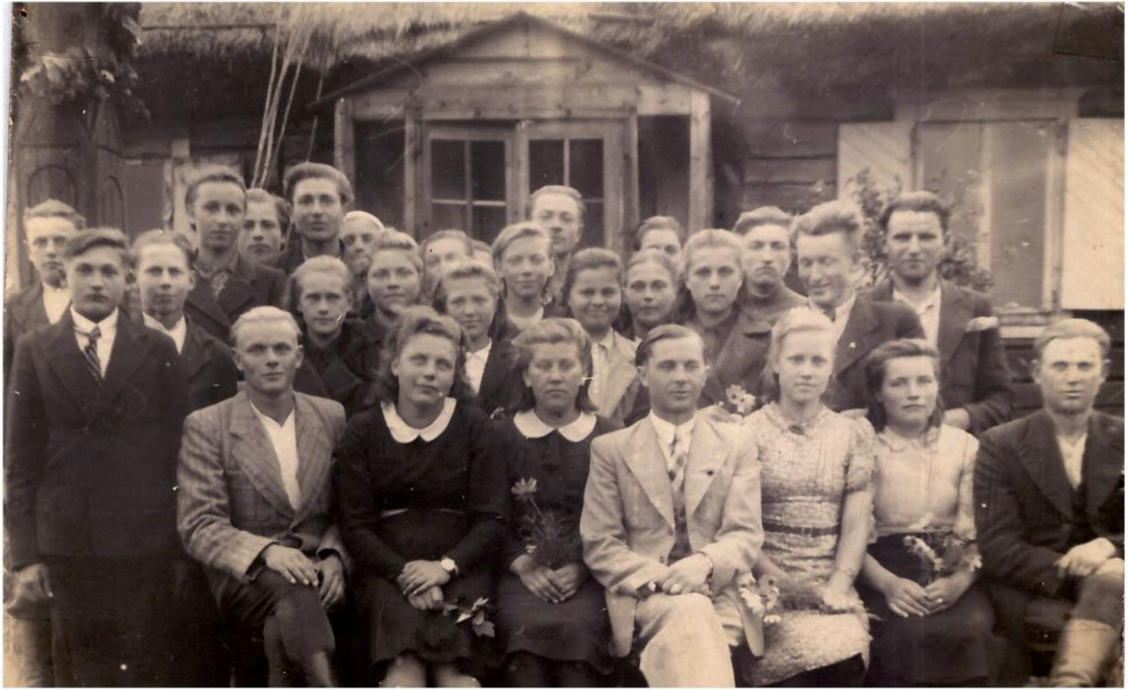
Sedeikių kaimo jaunimas 1943 m.